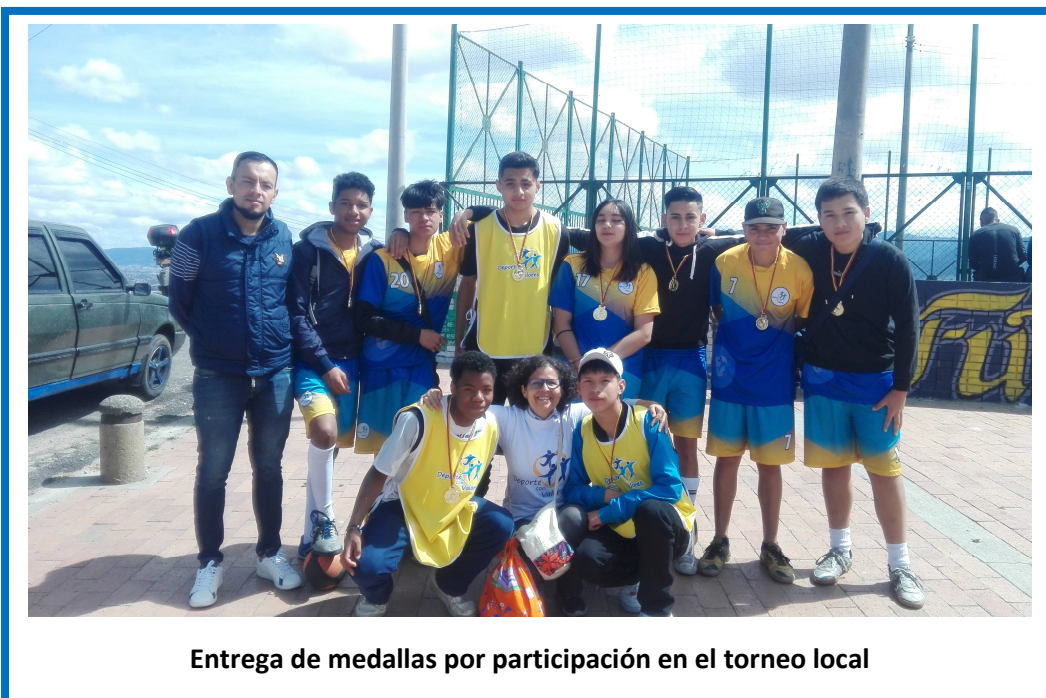
Entrega de medallas por participación en el torneo local

los nombres de los chicos que habían iniciado el pago de los mismos.