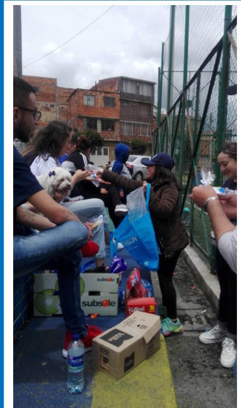
Visita Empresa BDP