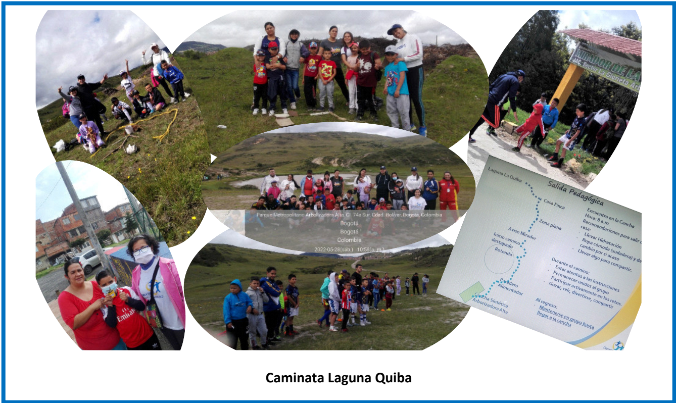
Caminata Laguna Quiba