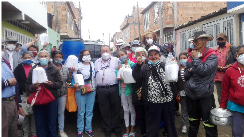
En solidaridad con la Fundación María Refugio del Amor Santo compartimos tapabocas

el grupo de los pequeños quienes asistieron con sus familias. Del grupo de los jóvenes solo nos acompañó un chico y su familia. La caminata buscó la integración de las familias y las escuelas, el fortalecimiento del trabajo en equipo a través del desarrollo de acertijos, retos y la actividad física. Esto se realizó durante el recorrido y en la laguna. Otro elemento importante fue la promoción del cuidado del ambiente recolectando los residuos que se encontraron en el camino. Para finalizar se hizo un compartir, con el aporte de los participantes. El sábado siguiente a la caminata, se premió a los participantes entregándoles unas plantitas suculentas para su cuidado.