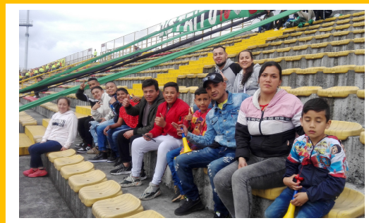
Partido La Equidad Deportivo Pereira