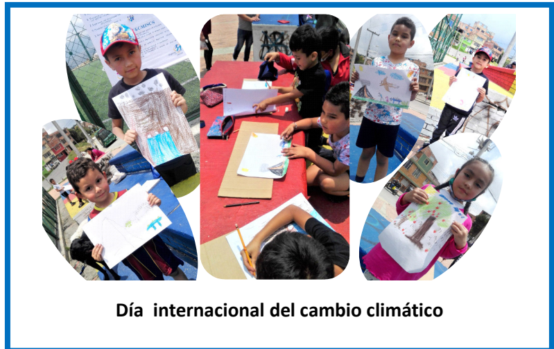
Día internacional del cambio climático

También iniciamos la participación en un torneo local, lo que permitió darnos a conocer en la comunidad y generar nuevas relaciones.